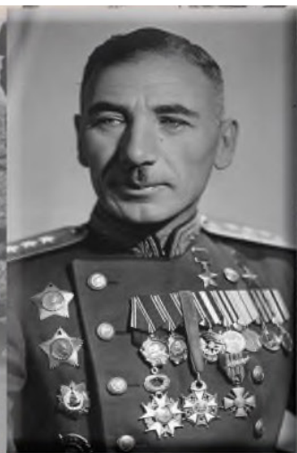
Исса ПЛИЕВ (1903-1979)