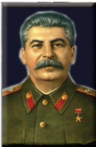
Иосиф СТАЛИН (1879-1953)