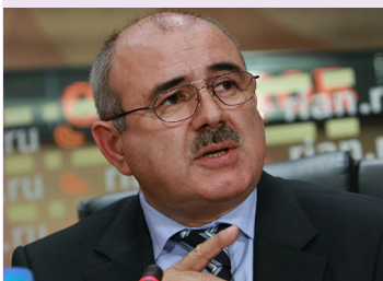
Дмитрий МЕДОВЕВ, министр иностранных дел РФ:

«Грузины до сих пор не усвоили простой вещи – поезд давно ушел, а они до сих пор стоят на остановке под названием «ГССР». Пора снять розовые очки» (ИА «Рес», 28.09.2019).